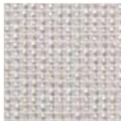
TS_22 Ivory trevira wave Rete trevira avorio

Абажуры из ткани Trevira (цвет на выбор из палитры фабрики), на фото TS_22. Ткань производства DEDAR, трудновоспла меняемая, удовлетворяе т актуальным требованиям противопожа рных нормативов